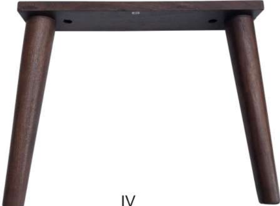
IV Cleat Leg 3X