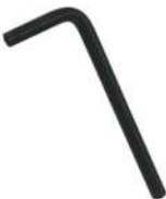
II Allen Key 1X