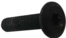
I Allen Bolt 16X(12.5Øx23mm)