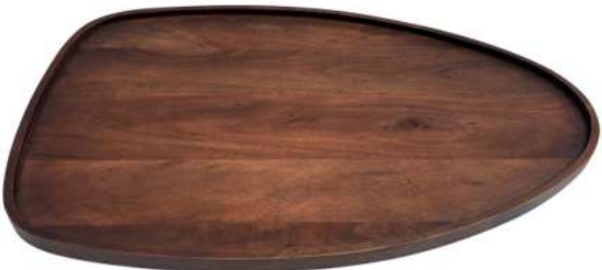
III Wooden Top 3X