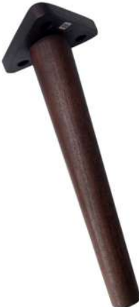
V Single Leg 3X