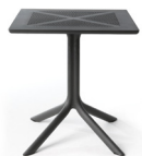
ANTRACITE * 40085.02.000